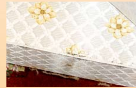
box spring somier