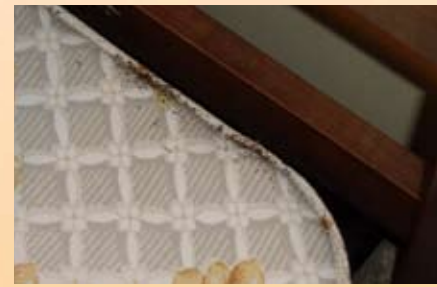
mattress edges bordes del colchón