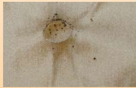
mattress tufts costuras del colchón