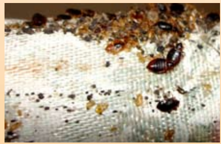
mattress folds pliegues del colchón